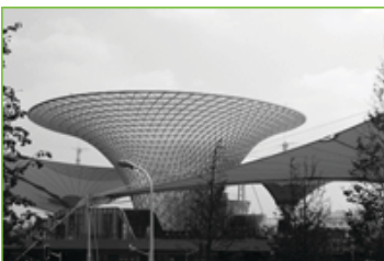
Centro de Exhibiciones